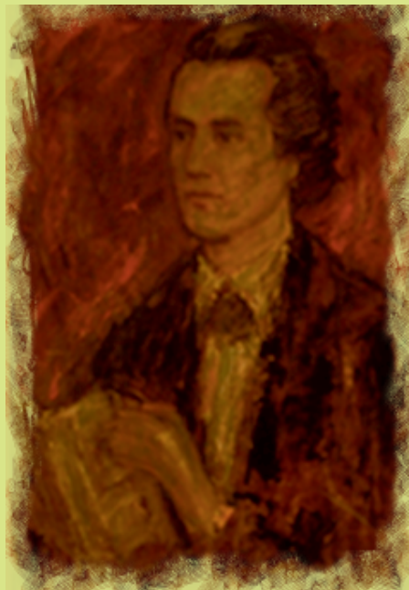
Portret al lui Mihai Eminescu realizat de Ion Țânțaș