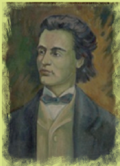
Mihai Eminescu, pictură de Radu Șonieriu